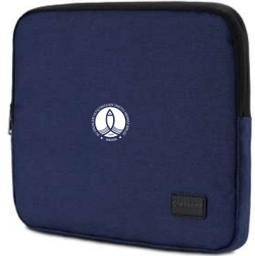
Örnek Çanta Modelleri